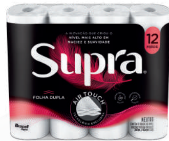
Papel Higiênico Supra Folha Dupla - 30m 12 rolos - FD c/6 P50016 7908782500165