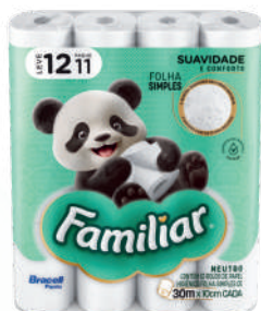
Papel Higiênico Familiar Folha Simples - 30m 12 rolos - FD c/6 P50007 7908782500073