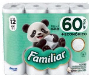
Papel Higiênico Familiar Folha Simples - 60m 12 rolos - FD c/6 P50008 7908782500080