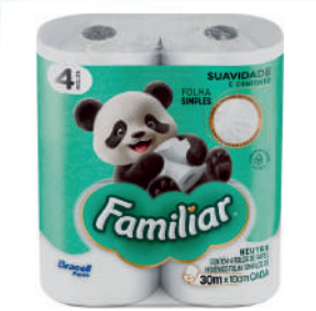
Papel Higiênico Familiar Folha Simples - 30m 4 rolos - FD c/16 P50005 7908782500059