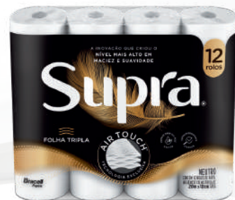
Papel Higiênico Supra Folha Tripla - 20m 12 rolos - FD c/6 P050020 7908782500202