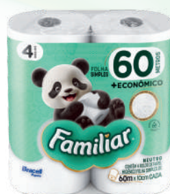
Papel Higiênico Familiar Folha Simples - 60m 4 rolos - FD c/16 P50006 7908782500066