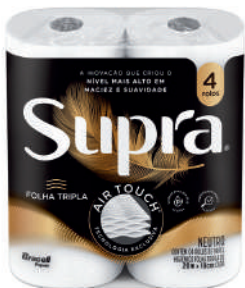
Papel Higiênico Supra Folha Tripla - 20m 4 rolos - FD c/16 P50019 7908782500196