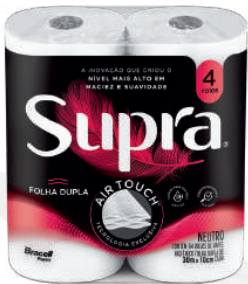
Papel Higiênico Supra Folha Dupla - 30m 4 rolos - FD c/16 P50015 7908782500158